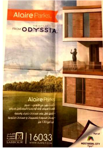
الشكل رقم (٢١) صحيفة المصري اليوم الخميس ٢٠ سبتمبر ٢٠١٨ العدد ٢٥١١

* الألوان: جاءت الصورة الأولى باللون البرتقالي الذي هو مزيج بين اللون الأحمر والأصفر، وهو لون محفز وملفت للانتباه لجذب نظر القارئ إلى قراءة الإعلان، ثم جاءت الصورة الثانية باللون الأزرق الداكن كدلالة على الاستقرار والأمان والثقة في استخدام هذا التطبيق، ثم جاءت الصورة الثالثة باللون البنفسجي والذي هو مزيج بين الأحمر والأزرق، كدلالة على الحكمة والاستفادة من هذا التطبيق.