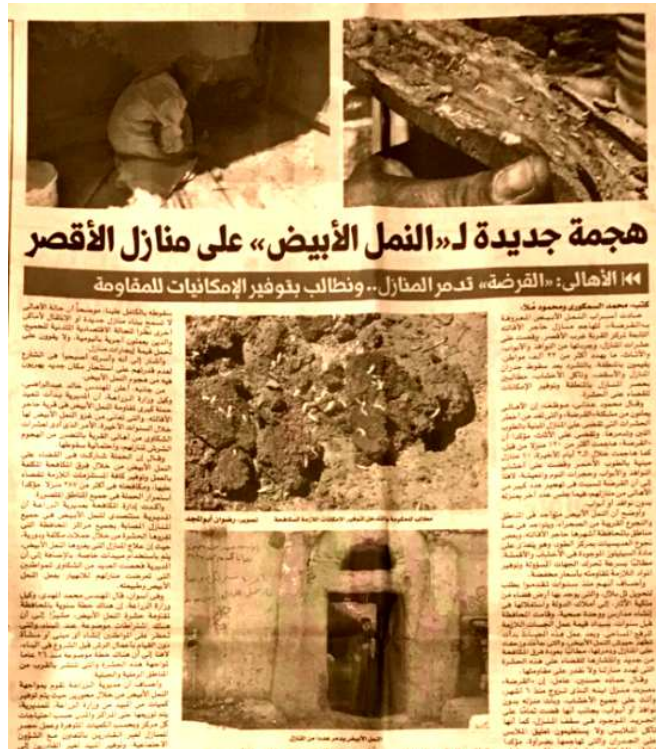
الشكل رقم (٩) صحيفة المصري اليوم الأربعاء ١٢ سبتمبر ٢٠١٨ العدد ٥٢٠٣

* الألوان: جاءت الصورة خالية من الألوان لإعطاء الإيحاء بتهالك وقدم المبنى الذي تم تصويره.