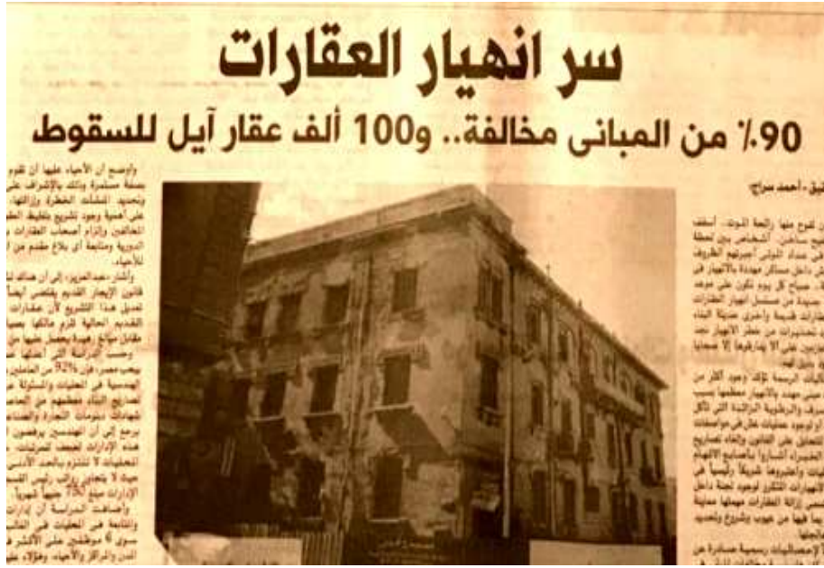
الشكل رقم (٨) صحيفة الوفد الإثنيين ٢٢ أكتوبر ٢٠١٨ العدد ٩٨٩٠