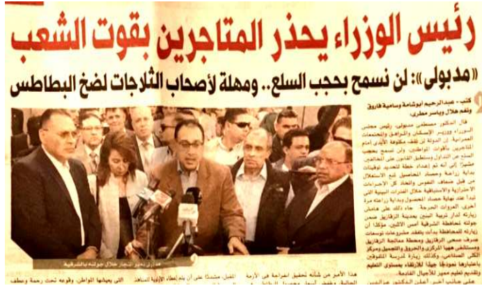
الشكل رقم (١٤) صحيفة الوفد الثلاثاء ٣٠ أكتوبر ٢٠١٨ العدد ٩٨٩٧

* الألوان: جاءت الصورة متضمنة بعض الزهور باللون البرتقالي وهو اللون الذي يجمع بين طاقة اللون الأحمر وسعادة اللون الأصفر، ويرتبط هذا اللون بالبهجة والحماس والسعادة، بالإضافة إلى أنه يمثل الإبداع والجدب والنجاح، والتشجيع والتحفيز للقيام بأمر ما، وهو ما يتناسب مع موضوع الاجتماع.