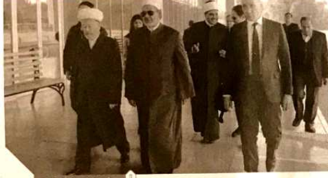
1 شيخ الأزهر في أوزبكستان

أعلن فضيلة الإمام الأكبر الدكتور أحمد الطيب، شيخ الأزهر الشريف، رئيس مجلس حكماء المسلمين، أمس في ختام زيارته لجمهورية أوزبكستان، التي استمرت 4 أيام، أن الأزهر الشريف يعتزم تنظيم مؤتمر عالمي عن الإمام أبي منصور الماتريدي العام المقبل بمشاركة مجلس حكماء المسلمين، والمؤسسات الإسلامية وعلماء أوزبكستان، مسقط رأس ذلك العالم الجليل وأوضح فضيلته، أن الإمام أبان منصور الماتريدي، الذي ولد في مدينة سمرقند الواقعة حالياً في أوزبكستان، هو أحد أعلام الفكر الإسلامي الكبار، الذين بذلوا جهداً كبيراً في الدفاع عن العقيدة الإسلامية، والرد على شبهات المخدعين والماديين، جامعاً في ذلك ما بين الألفة اللطيفة والعقيدة، وهو يحمل القاماً كثيرة مثل إمام الهدى، وعلم الهدى، وإمام المتكلمين، وشدد الإمام الأكبر على أن الأزهر حريص على تعريف الأمة بجهود وتراث هؤلاء الأئمة الكبار، لما يمثله ذلك من توضيح عملي لحقيقة تعاليم الإسلام السمحة، وقيمة التي تدعو للتسامح والحوار والتعايش، موضحاً أن هؤلاء الأئمة تصدوا في وقت مبكر لأفكار التكفير والتطرف، بمقدار تصديهم لأفكار الإحاد والتفرقة، ويرهنا على اتخاذ الإسلام لكل ما فيه خير البشرية، كما توجه الإمام الأكبر إلى إيمانها، المحطة الأخيرة في جولته الخارجية، التي