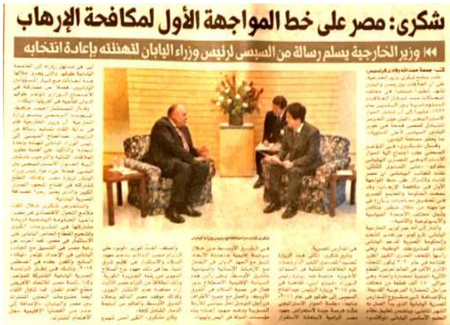
الشكل رقم (٦) صحيفة المصري اليوم السبت ٦ أكتوبر ٢٠١٨ العدد ٥٢٢٧

* الألوان: جاءت الصورة خالية من الألوان فملابس الأئمة من العباءة والمعطف والعمامة والقبعة الخاصة بأئمة جمهورية أوزبكستان تتراوح ما بين اللون الأبيض والأسود والرمادي، لذا فنشر الصورة بالألوان سيصبح قريباً من نشرها خالية من الألوان.