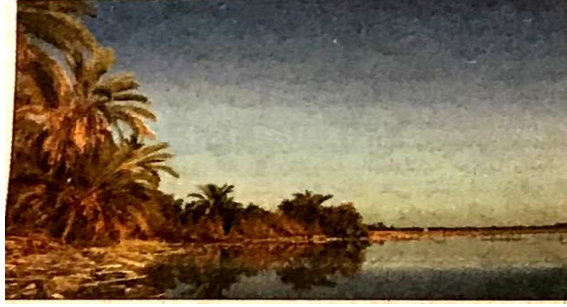
الشكل رقم (١٦) صحيفة الأهرام الثلاثاء ٣٠ أكتوبر ٢٠١٨ العدد ٤٨١٧٥

هي صور تعرض للإبداع الفني يقوم بها مصورون صحفيون أو مبدعون هاوون، وتعتمد على موهبة المصور الفنية أو الجمالية وذلك باختيار تكوينات معينة وتوظيفه للغة الشكل في الصورة (٣٥) ، (انظر الشكل رقم ١٦، ١٧، ١٨).